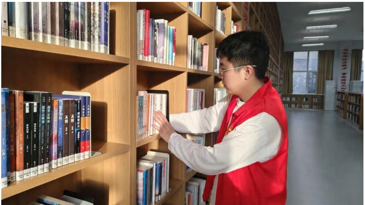
2025 年寒假志愿者服务