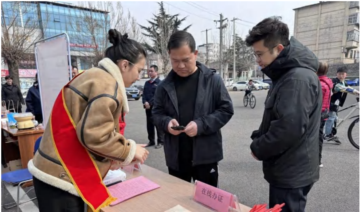
2025. 3. 15 学雷锋志愿服务活动