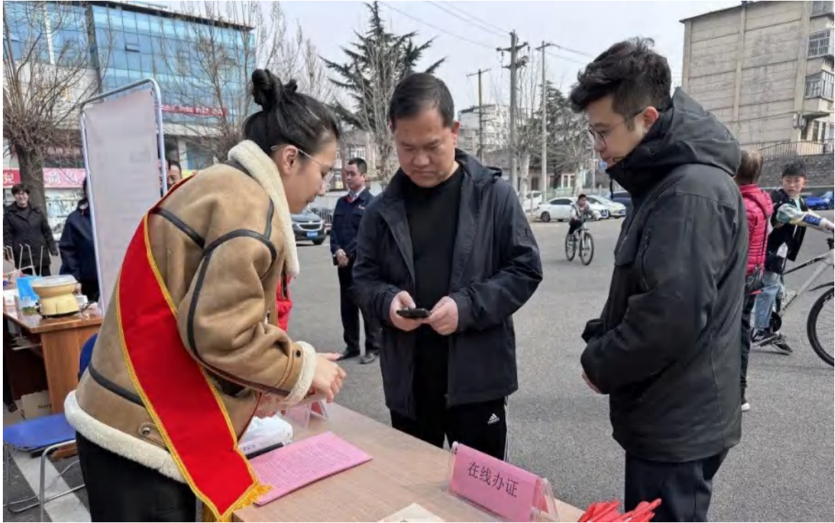
2025. 3. 15 学雷锋活动