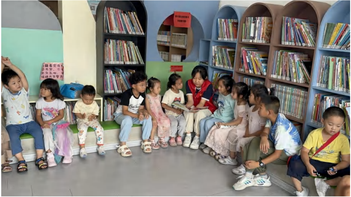
2025 年志愿者阅读推广活动