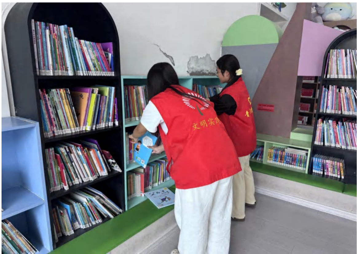
2025 年暑期志愿者服务