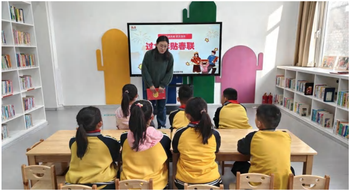
2025.1.25 “我的祖国我的节” —— 《过大年贴春联》绘本讲读