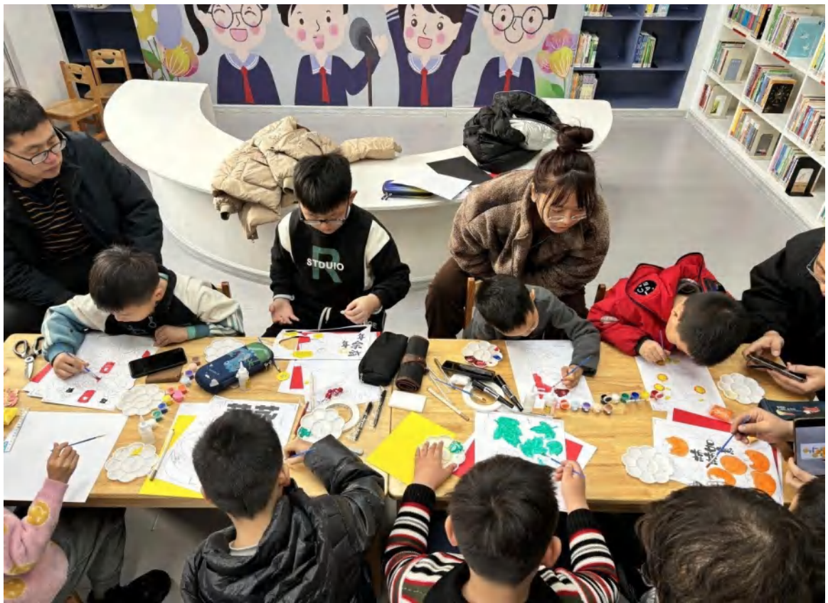
2025.1.24 “我的祖国我的节” —— 《手工粘贴画》