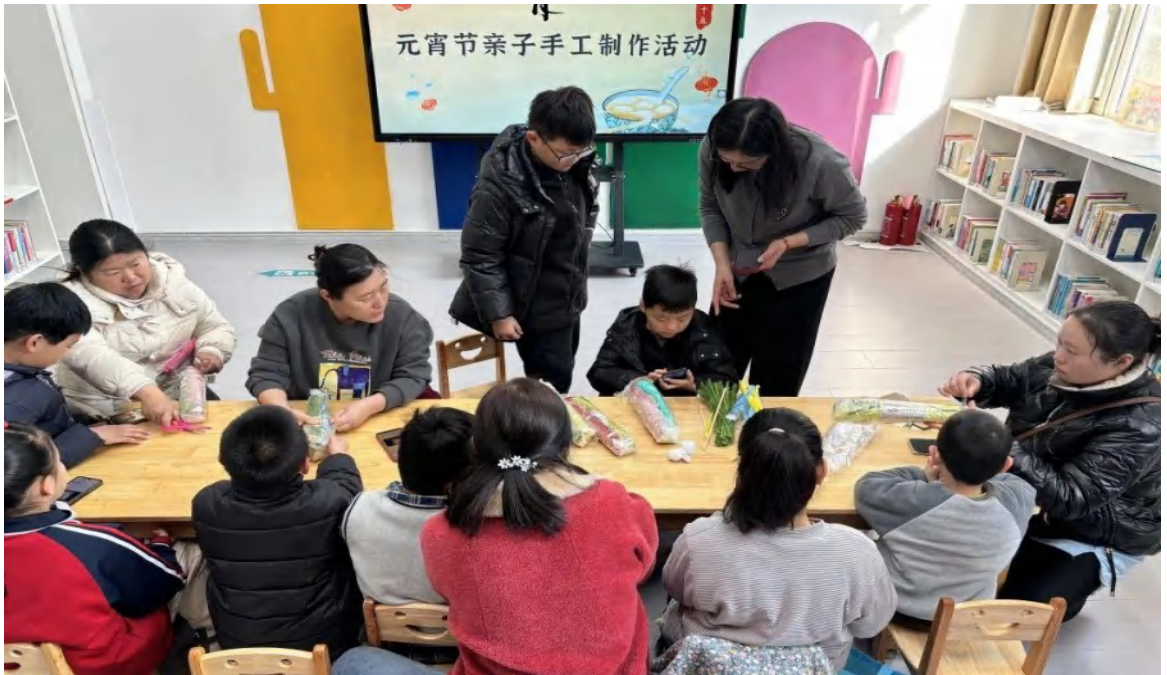
2025. 2. 12 “我的祖国我的节” ——元宵节系列活动