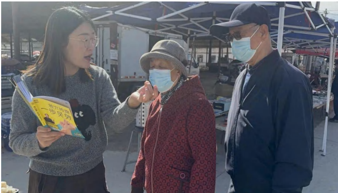
2025. 3. 19 “夕阳红书坊” 老年穴位养生活动