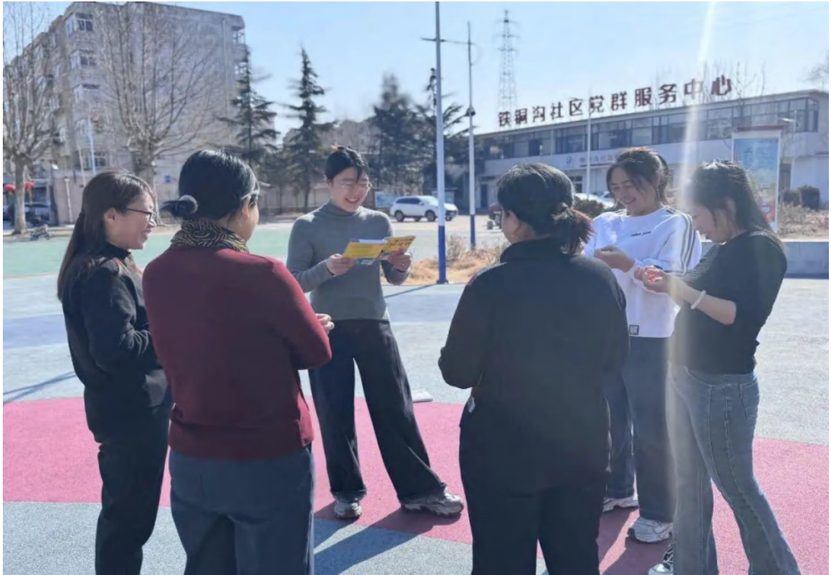
2025. 2. 20 “夕阳红书坊” 老年养生活动