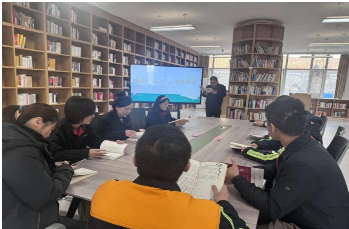
2025. 3. 7 “三八” 妇女节读书会