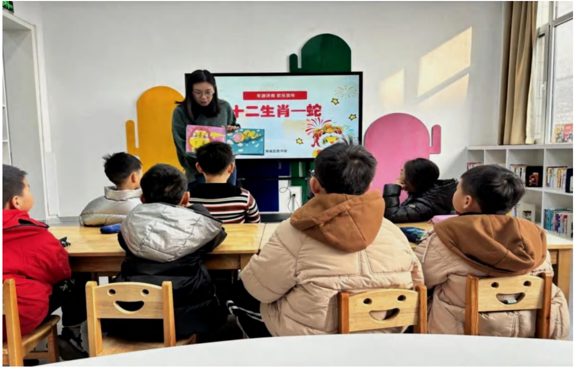
2025.1.24 “我的祖国我的节” —— 《十二生肖一蛇》绘本讲读