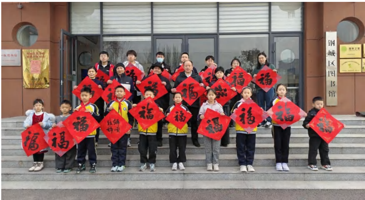
2025.1.25 “我的祖国我的节” 写福赠福